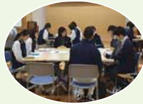
12/16管理者・相談員意見交換会の様子

この会は、南区の介護サービス事業所が多く加入し、さまざまな職種が所属しております。みなふくねっとでは、同じ南区で働く職種同士で意見交換や勉強会を開催し、南区の福祉が発展するよう、何より区民の皆様が安心してサービスを使えるよう取り組んでおります。