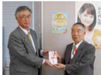
白根ガス株式会社 白根支店様よりいただきました寄付金の贈呈式を行いました。