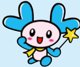
新潟市社協キャラクター きらりん