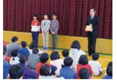
新飯田小学校 贈呈式