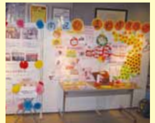
パネル展示コーナー