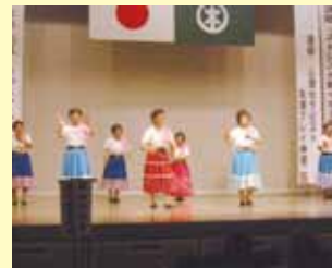
レクリエーションダンス発表会のようす

今年は10月4日(土)の開催です。アトラクションの出演については福祉や健康に関する出し物を公募いたします。