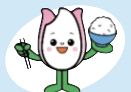
新潟市食育・花育推進キャラクター まいかちゃん

南区介護レンジャー きらりん、トッキッキ、まいかちゃん が来るよ! 一緒に記念撮影してね!