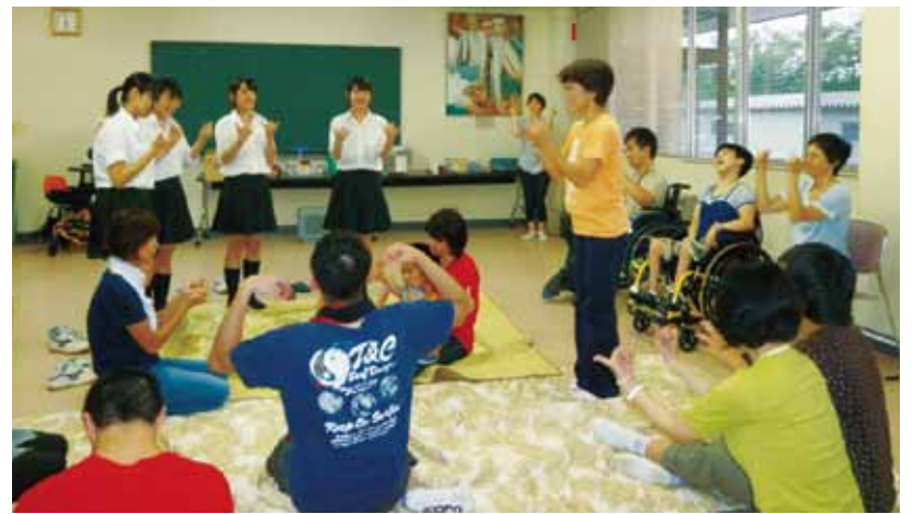
高校生ボランティアさんが大活躍！