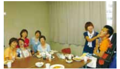
みんなでカレーを食べました

毎年、8月上旬に「夏期訓練」を行っています。今年は8月9～10日の二日間、白根地域生活センターで実施しました。ここでも、ボランティアさんが大活躍でした！