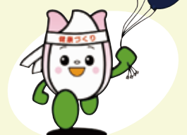
新潟市食育・花育推進キャラクター まいかちゃん