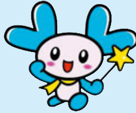
新潟市社協キャラクター きらりん

平成26年9月21(日)日発行 社会福祉法人 新潟市社会福祉協議会 南区社会福祉協議会 新潟市南区上下諏訪木817番地1 TEL373-3223 FAX373-6125