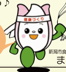
新潟市食育・花育推進キャラクター まいかちゃん