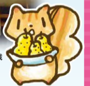
はかるう体重! 大作戦 PRキャラクター はかりすくん