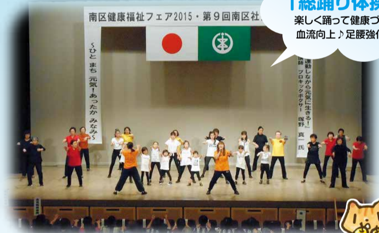
南区健康福祉フェア2015・第9回南区社