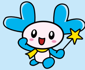
新潟市社協キャラクター きらりん

平成28年9月25日(日)発行 社会福祉法人 新潟市社会福祉協議会 南区社会福祉協議会 新潟市南区上下諏訪木8 1 7番地1 TEL373-3223 FAX373-6125