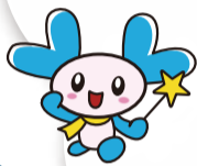
新潟市南区社協キャラクター きらりん

日時 10月7日(土) 会場 白根学習館 10:00~15:45 南区田中383