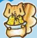
はかるう体重!大戦 PRキャラクター はかりすくん