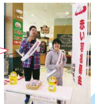
平成30年度街頭募金の様子 協力：NPO法人「ゆうーわ」