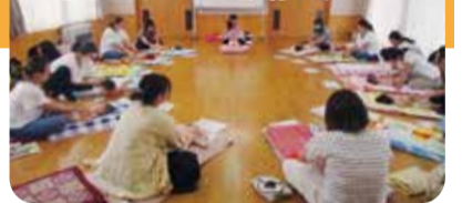
大通地区 こんにちわ赤ちゃん

南区社会福祉協議会では、地域福祉推進の財源として企業・団体の皆様から賛助会費のご協力をいただいております。南区社会福祉協議会の活動にご理解をいただき、ご支援とご協力をお願いいたします。なお、賛助会費は、個人1口500円、団体1口2,000円、企業1口5,000円を年間を通じて受け付けております。