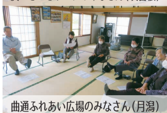
曲通ふれあい広場のみなさん(月湯)