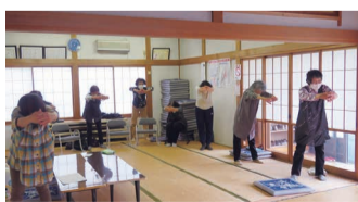
庚いさきサロンのみなさん(茨曾根)

みなさまがお集りになる際にひと運動して、筋肉、関節、骨を丈夫にいたしましょう。認知症を予防して免疫力も高めるんですよ!