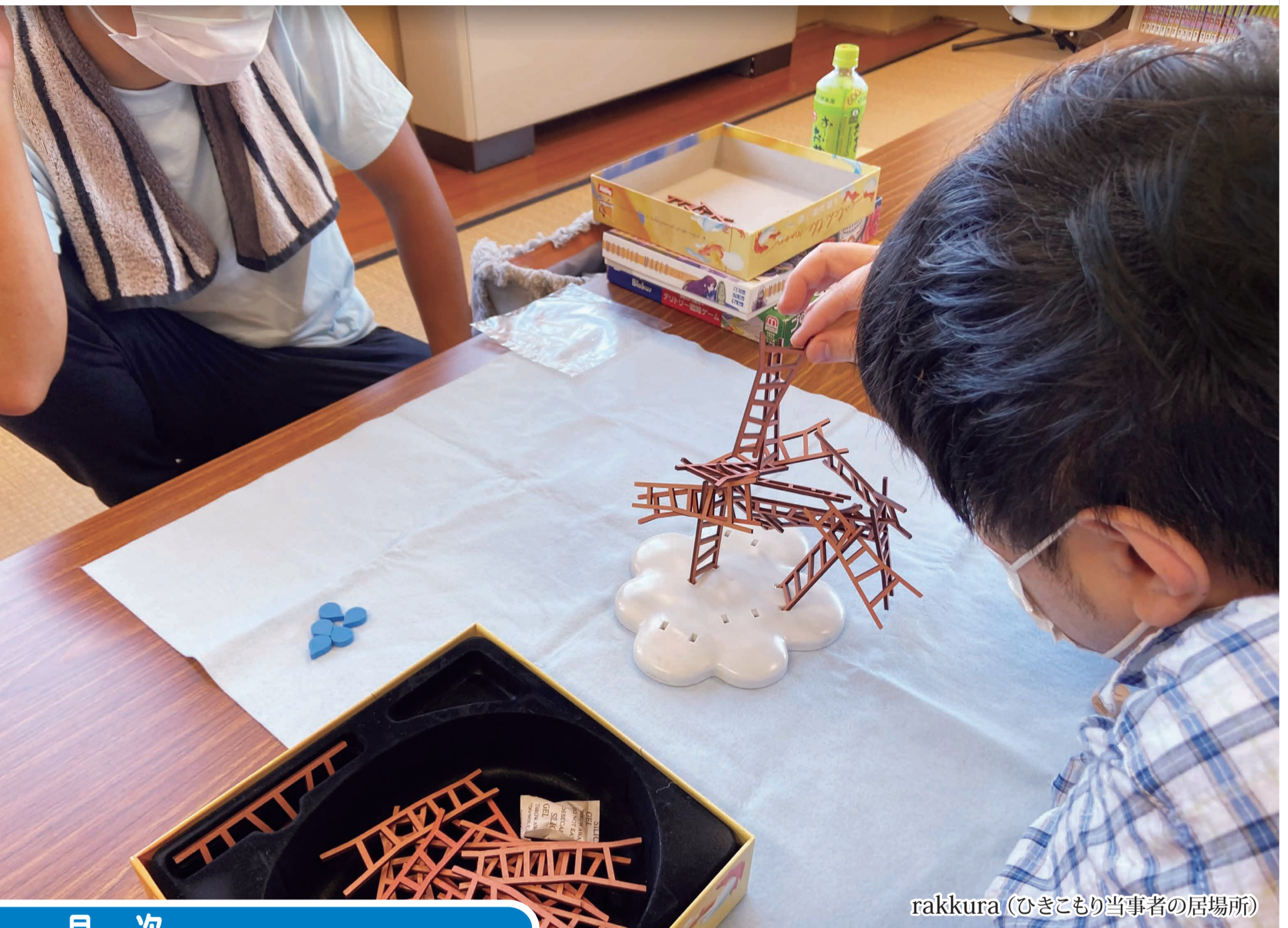
rakkura (ひきこもり当事者の居場所)