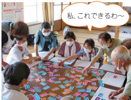
「中大郷の茶の間」 中学生も交えての、助け合いゲーム 自分のできるカードを選びました！

お茶を飲みながらお話したり、体操やレクリエーションで季節のイベントを楽しんだり、運営する人と参加する人が「居場所」を一緒に作り上げていきます。