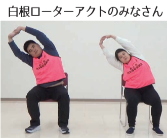
白根ローターアクトのみなさん

ご希望の方には、DVDを無料で差し上げます。お申し込みは南区社協 ☎373-3223まで。