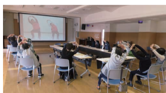
憩いの場のみなさん(白根)

ご希望の方には、DVDを無料で差し上げます。お申し込みは南区社協 ☎373-3223まで。