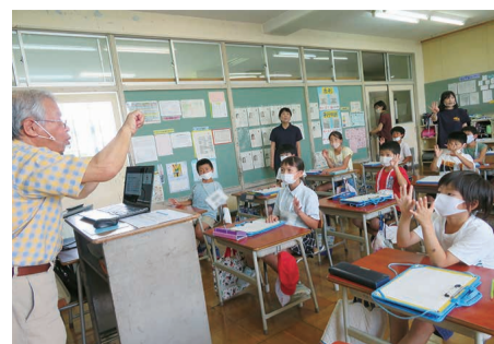
福祉教育(手話を学ぶ) 新飯田小学校